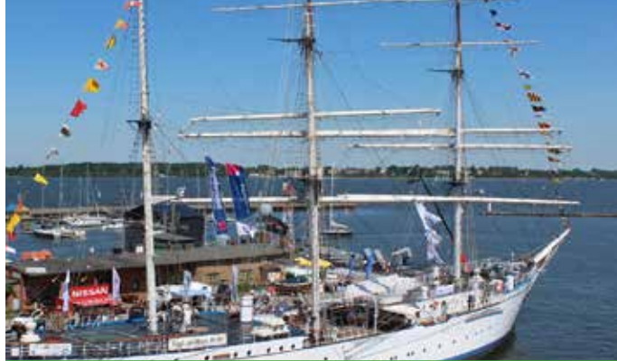
GORCH FOCK 1